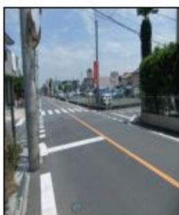
早期の信号機設置が望まれる交差点

死亡事故がの発生した箇所の安全性の確保を最優先と考え、交差点を拡幅し、定期期の信号機設置について検討中との回答がありました。