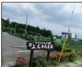
上尾市民農園 アグリプラザ平塚